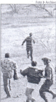
> GOLPES. Los medios de comunicación publicaron testimonios de los abusos en Oaxaca.

Redacción > El Herald diario@elheraldo.hn