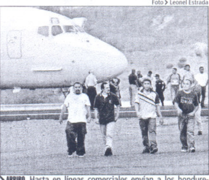
> ARRIBO. Hasta en líneas comerciales envían a los hondureños

Se calcula que solo un cinco por ciento (de 185 mil que cada año abandona el país) logra su cometido de llegar a establecerse en la nación del norte, el resto regresa al país en condición de deportado. La Dirección de Migración estima que vía terrestre, o sea, desde México y Guatemala, la cifra de retornados ronda los 14 mil. Para finales de año se ha proyectado que los deportados desde Estados Unidos alcance los 35 mil, según Valdette Willeman, encargada del CAMR. En 2007 vinieron 29 mil. ■